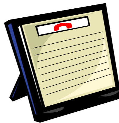
Caption describing picture or graphic.

You can also use this space to remind readers to mark their calendars for a regular event, such as a breakfast meeting for vendors every third Tuesday of the month, or a biannual charity auction. If space is available, this is a good place to insert a clip art image or some other graphic.