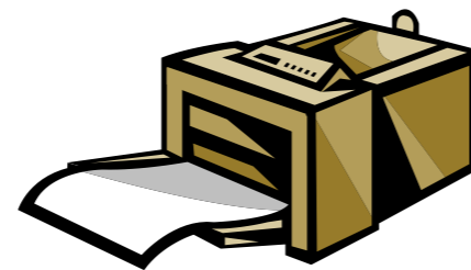
Caption describing picture or graphic.

One benefit of using your newsletter as a promotional tool is that you can reuse content from other marketing materials, such as press releases, market studies, and reports.