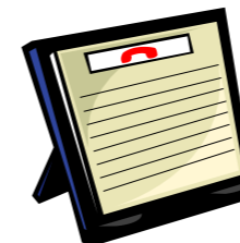
Caption describing picture or graphic.